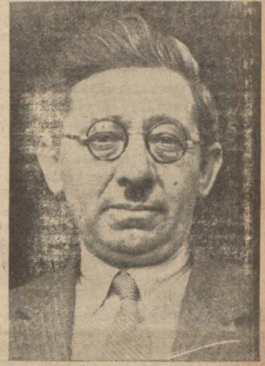
Maliye Vekili Fuad Ağralı