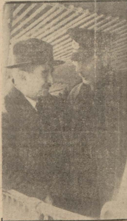
Orgeneral Kâzım Orbay

Ankara 28 (Hususi) — Ordu Müfettişi Orgeneral Kâzım Orbayın reisliğinde askerî bir heyetimiz yakında Londraya gidecektir.