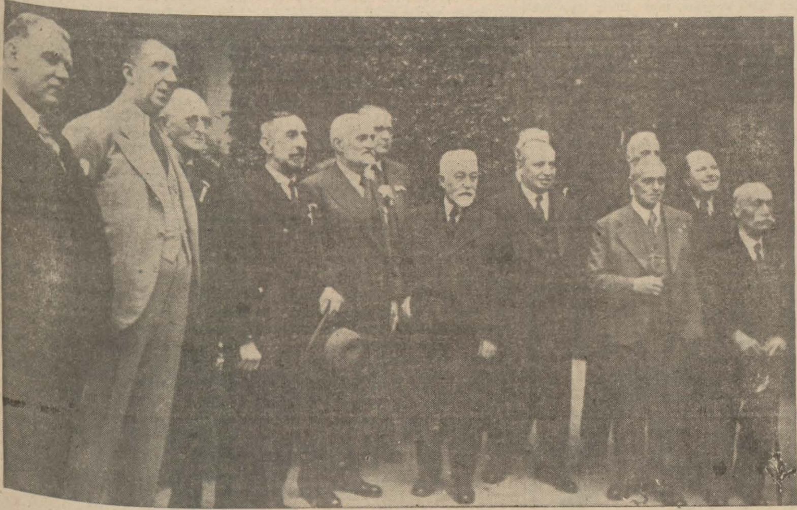
Yaşlı Galata saraylılardan bir grup mektebin bahçesinde

İhtiyar, genç Galatasaraylılar dün mektepte toplandılar, eski hatıralar canlandırıldı, abideye çelenk konuldu