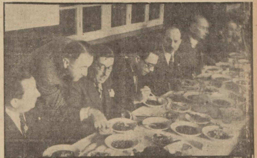
Galatasaraylılar neşe için de pilav yerlerken

İhtiyar genç Galatasaraylılar dün mektebde toplandılar, eski hatıralar canlandırıldı, abideye çelenk konuldu