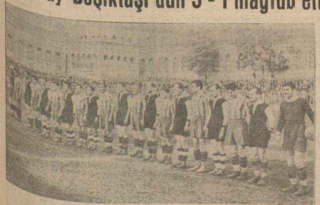
Galatasaray - Beşiktaş takımları sahada halkı selâmlarken

(Dün İstanbul'da yapılan futbol ve atletizm müsabakalarına ve Ankara'daki Greko - Rumen güreş birinciliklerine aid yazı ve resimleri 14 üncü sayfamızda bulacaksınız.)